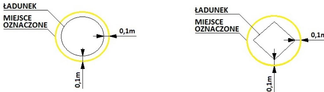
Rys. 1. Przykłady pól odkładczych

Pole odkładcze - krawędzie naniesione na podłożu (kredą, farbą, sprayem, taśmą itp.) wokół ładunku w punktach odkładczych; wskazane krawędzie (kolor żółty na rysunkach) należy nanieść na podłożu przed rozpoczęciem egzaminu praktycznego wg poniższych przykładów: